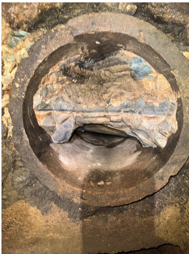
Obrázek 4 Protiproudění pohled dešťové stoky DN500 v Š1