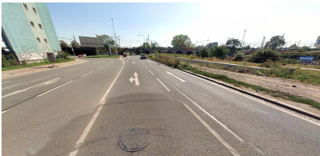
Obrázek 1 Pohled na zájmové území z křižovatky Heršpická-Opuštěná