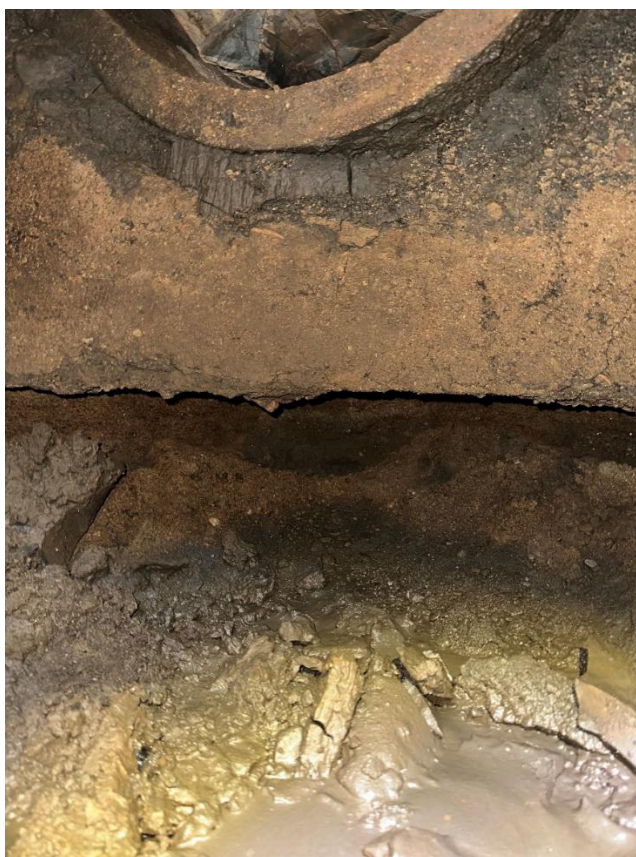
Obrázek 6 Kaverna pod přítokem šachty Š1