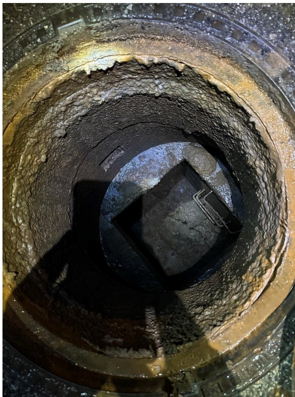
Obrázek 11 Pohled do šachty Š1