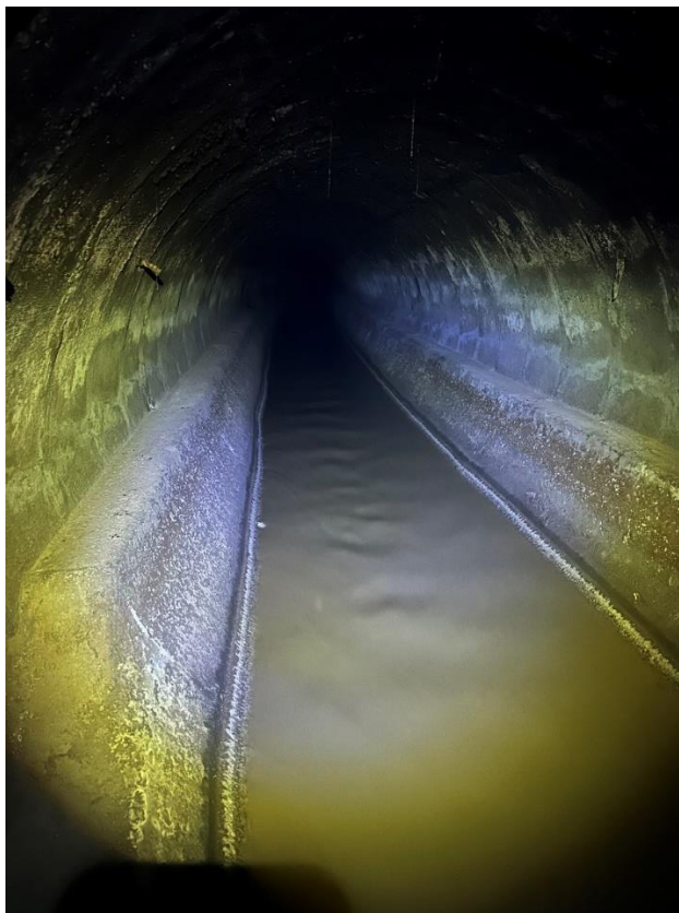
Obrázek 3 Kmenová stoka DN2500 – poproudní pohled