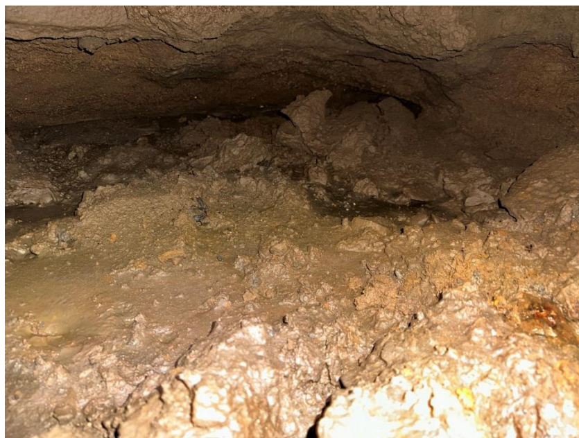
Obrázek 5 Kaverna pod šachtou Š1