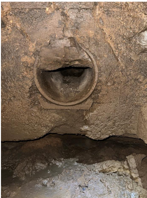
Obrázek 9 Pohled na boční odtok ze šachty Š1