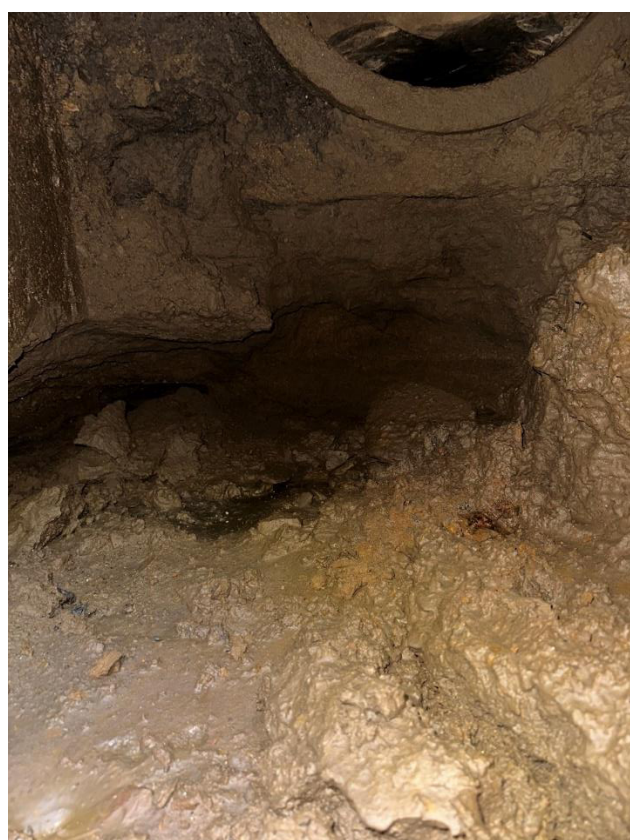
Obrázek 8 Kaverna pod výtokem ze šachty Š1