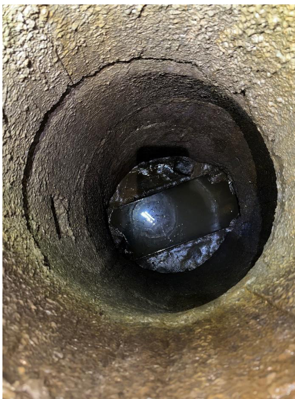
Obrázek 10 Pohled do stávající šachty v místě Šsp1