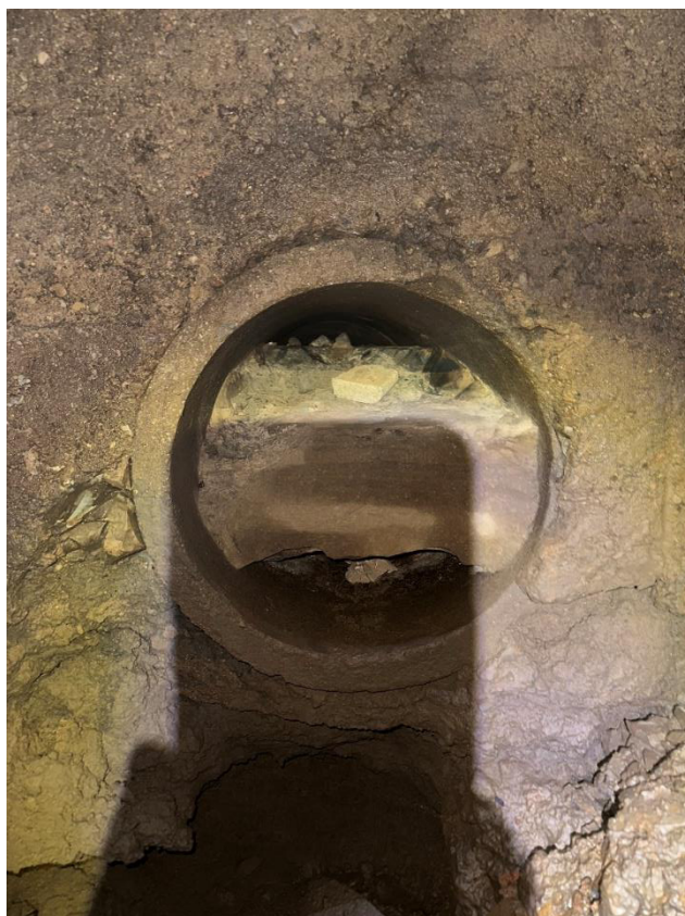
Obrázek 7 Pohled na výtok ze šachty Š1